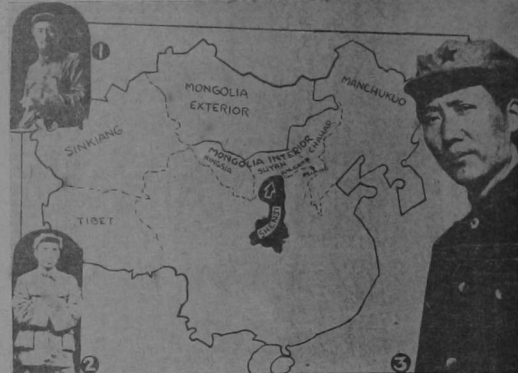
El mapa muestra la ubicación de la provincia de Shensi (en negro) de donde han partido los ejércitos comunistas chinos a encontrar a los japoneses que avanzaban en la Mongolia Interior. 1.—Pens Teh-nai, segundo comandante del Ejército Rojo, ahora Ejército N° 8 de Chiang Kai Shek, en las operaciones contra los japoneses. 2.—Chu Teh, ex mandante en jefe. 3.—Mao Tse Tung, ex jefe del Soviet Chino, ahora "encargado" de la Provincia de Shensi.

Por espectacular y trágico que no parezca el episodio de Shantghai, hay razones para creer que allí ni en Peiping, ni en Tientsin, ni a lo largo del Yangtze-Kiang, ni en Canton ni en Amoy, recién bombardeados, ocurrirán hechos decisivos y en todo caso los más novedosos de la guerra declarada con el Japon. Un despacho telegrafico de fecha 2 de setiembre nos ha tra-