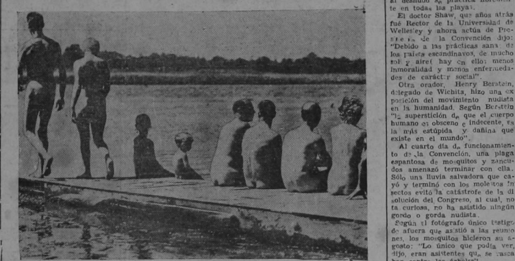
Un intermezzo en los debates de la Convención Nudista Americana reunida en Mays Landing, cerca de Nueva York.

"La superstición de que el cuerpo humano es la más estúpida y dañina que existe en el mundo", dice un apóstol. Una manga de mos quitos casi disuelve la asamblea.