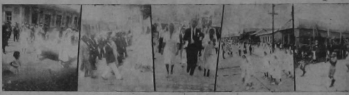
Diversos aspectos de la procesion de la salud verificada en la ciudad de Cartago el domingo en las horas de la mañana