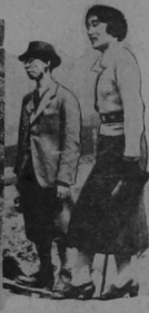
Foto de Hitler hablando al Octavo Congreso Nazi y Cuarto desde su ascension al poder en Nuremberg el año pasado. —El principe Chichibu y su esposa en Suiza.

"Esta natural comunidad de intereses entre la Alemania Nazi Socialista y la Italia Fascista se ha mostrado en los últimos meses más y más un elemento de unión en la Europa contra la imbecilidad católica. Nuestro acuerdo con el Japón sirve la misma misión fundamental, la de mantenernos unidos en la defensa de la civilización del mundo." El que habla es Hitler el 7 de septiembre, en la novena asamblea anual del partido nazi en Nuremberg y quinta apoteosis del Führer en la ciudad sagrada