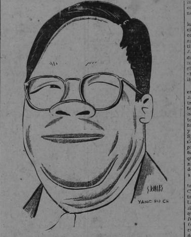
YANG HU CHENG

Fue él quien impuso el secuestro de Chiang Kai Shek que realizó la unión del Manchú con los comunistas y precipitó la guerra